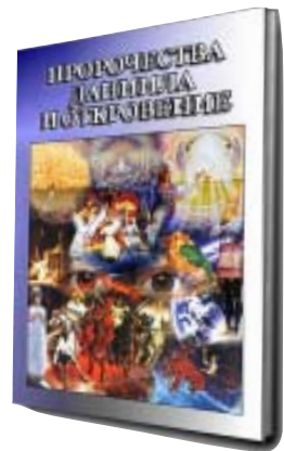
ПРОРОЧЕСТВА ДАНИИЛА И ОТКРОВЕНИЕ