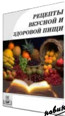
новинка РЕЦЕПТЫ ВКУСНОЙ И ЗДОРОВОЙ ПИЩИ