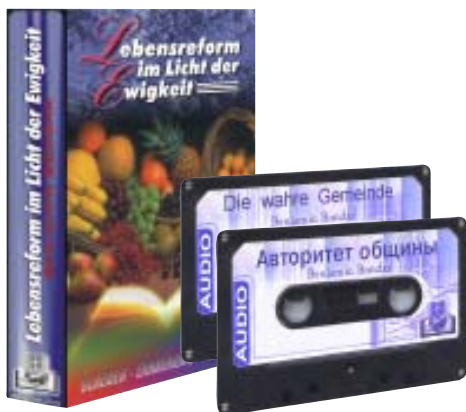
LEBENSREFORM IM LICHT DER EWIGKEIT