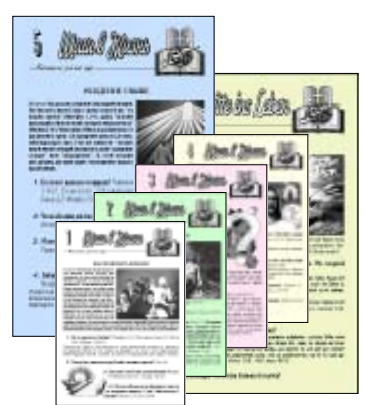
ШАГИ В ЖИЗНЬ заочный библейский курс