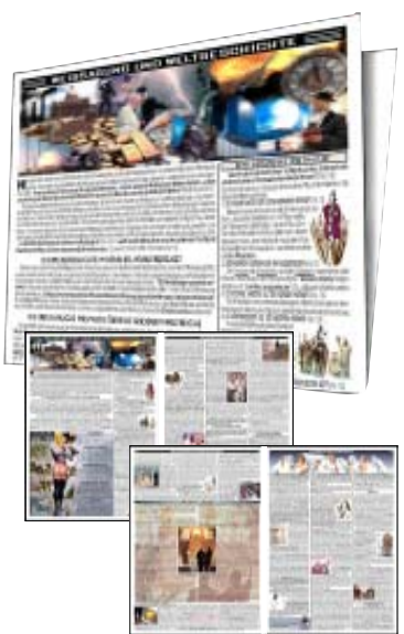
ПРОРОЧЕСТВО И МИРОВАЯ ИСТОРИЯ

Откровение, Божий суд, признаки принадлежности к Богу, одежда и питание христиан.