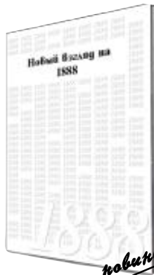
новинка НОВЫЙ ВЗГЛЯД НА 1888 ГОД