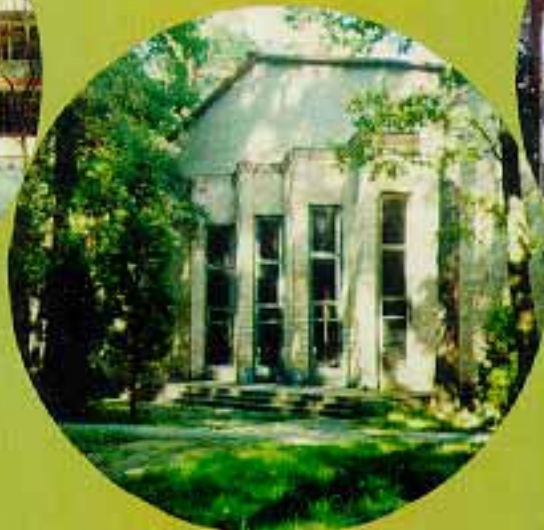
Главная аудитория (750 мест)