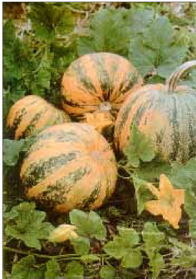
«Çíáíáíèÿ áðáíáíè» 3(24) 1999

Ðàçííáèáííñòú òùéááííúó — ïàðèññíú. Íèíáú á íèð ïèííèèá èèè èííóñííáðàçíúá, á áíèùøèíðòáá ñ èðóáèíçóá-àòúè èðáÿíè. Ííèíáð 5-8 áíááíð çá-áÿçú èííáðáèððòð, ááðÿð è æáðÿð. Óóðáííúá ïàðèñ-ñíú èíáðò áèóñ áðèáíá.