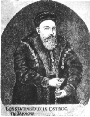
CONSTANTINUS IX IN OSTROG TH JARROW

làeüiüò òáðéíáíüò ìðáá- íēñáíēyò: «æíáái íá ó- áàò çáááái àēy ó-èíēíá ñáíēò, éíēē òíēüēí ÷ðáç Ó[ðēñò]à çááááiü... òñíðá- ááēēáái° áñò uēðíá ēáñ- ēē Áíæáē ÷áðç ááðò Óðēñóíáò, à íá ÷áðç ó-èí- ēē çáēííü».