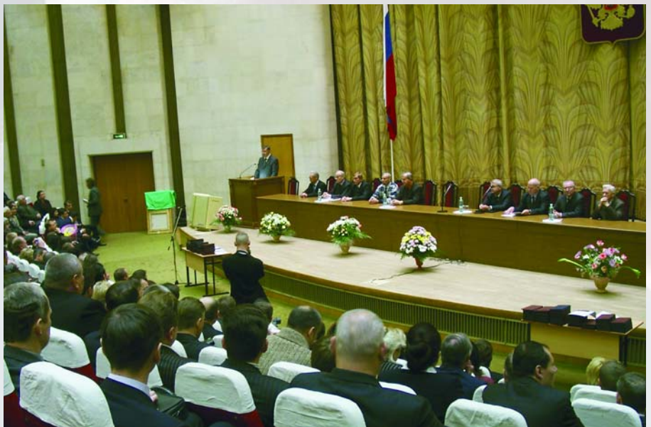
Круглый стол в РАГС.