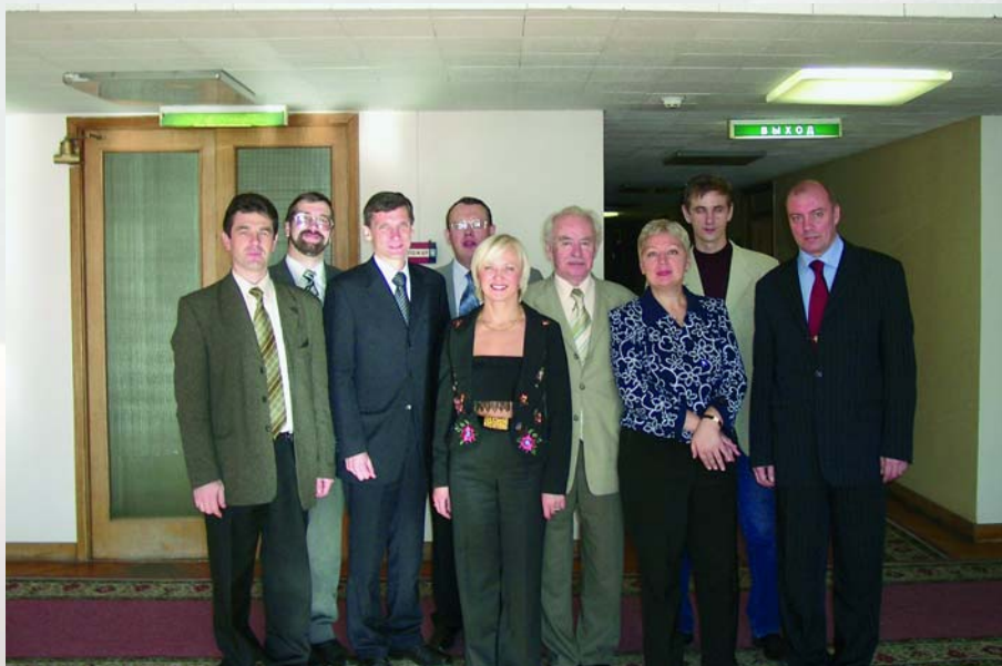
Преподаватели РАГС со студентами-адвентистами.

Многие системы управления, изучаемые в рамках этого предмета, имеют библейское происхождение. К примеру, система управления, подсказанная Иофором Моисею в книге Исход (гл. 18), затем вошла в учебники по теории управления как иерархическая, а многие современные ученые пришли к тому же принципу работы с людьми, который известен нам как «золотое правило» из Евангелия от Матфея 7:12: «Итак, во