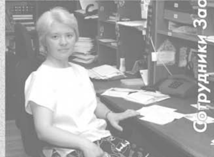
Сотрудники Заочной библейской школы