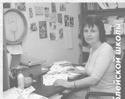
Сотрудники библейской школы