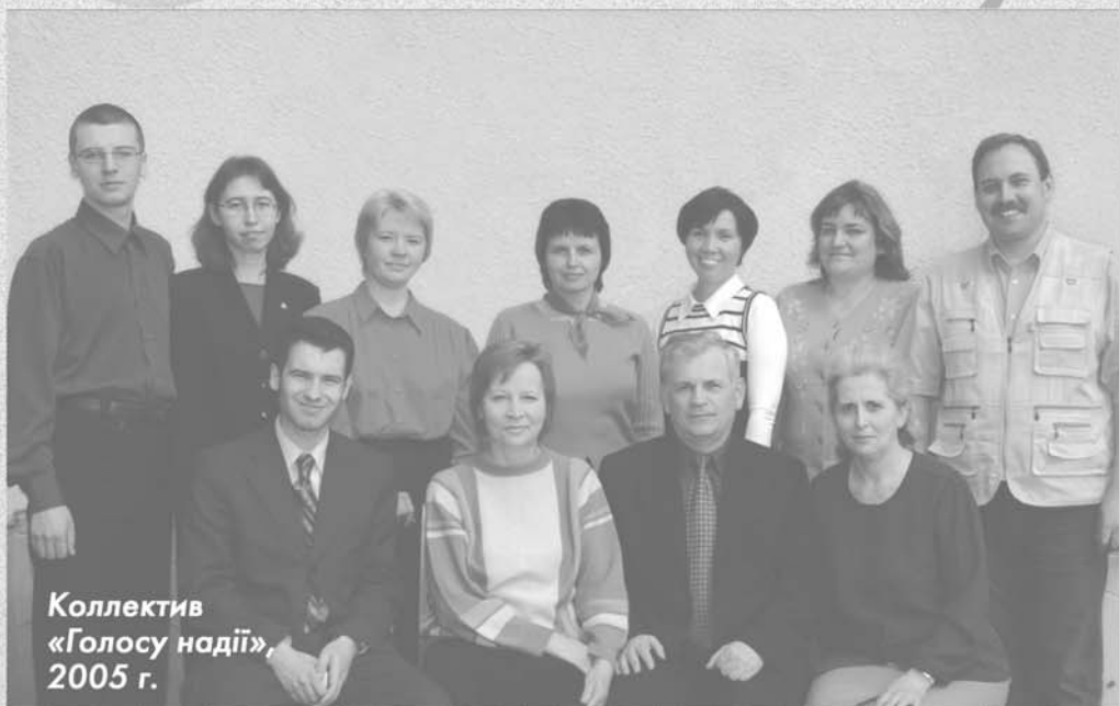
Коллектив «Голосу надії», 2005 г.