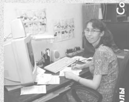
Сотрудники Заочной библейской школы