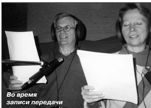
Во время записи передачи

сделать запись своего первого альбома. Работая вместе с ними, он обратил внимание на их отношения друг к другу и к тому, во что они верили. На него, как на светского человека, это произвело глубокое впечатление и подтолкнуло к принятию жизненно важного решения – идти за Господом и принять водное крещение. Так Господь пополнил команду работников «Голосу надії» еще одним сотрудником-христианином.