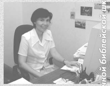
Сотрудники библейской школы