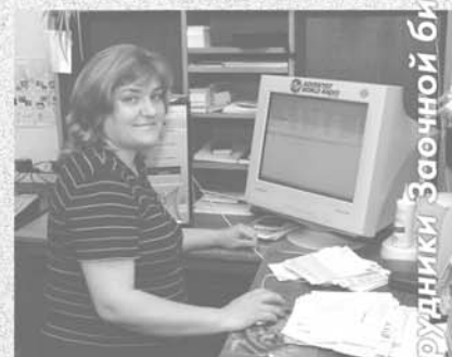
Сотрудники Заочной библейской школы