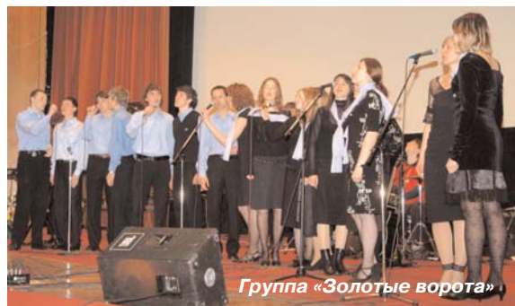
Группа «Золотые ворота»