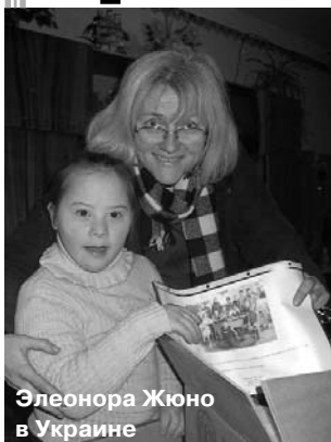
Элеонора Жюно в Украине